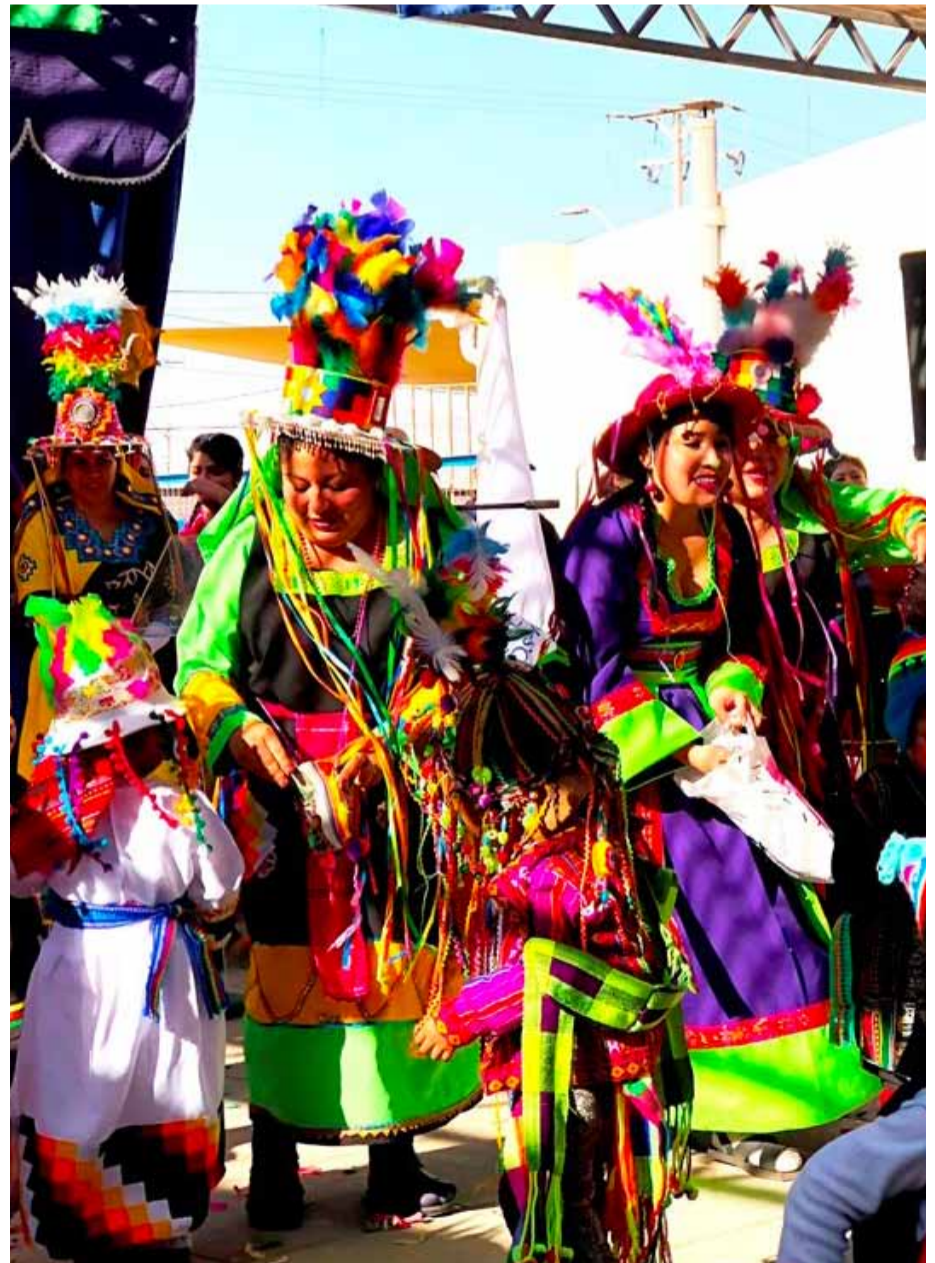
El colorido cultural del norte se hizo parte de esta celebración