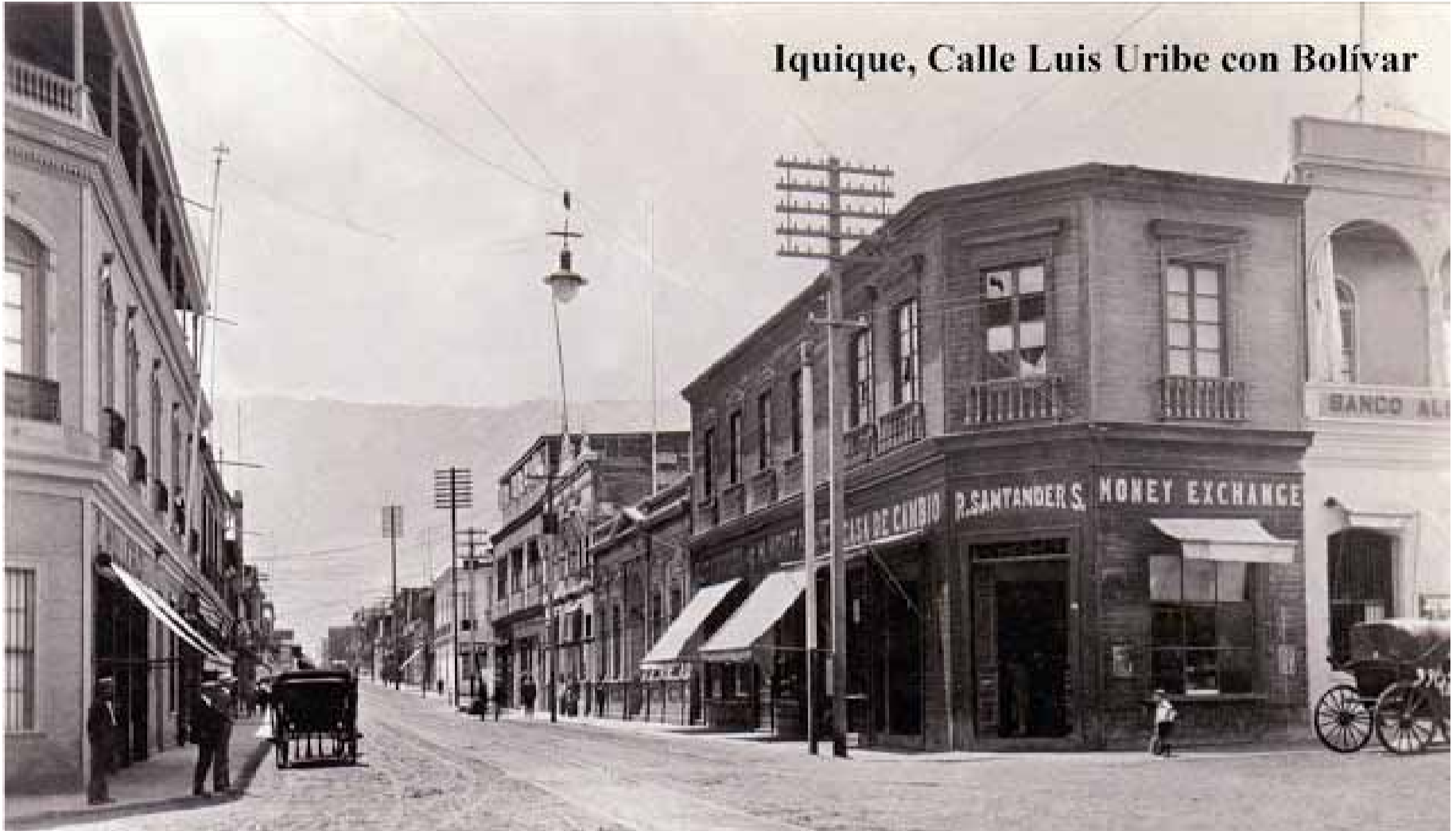
Iquique, Calle Luis Uribe con Bolívar